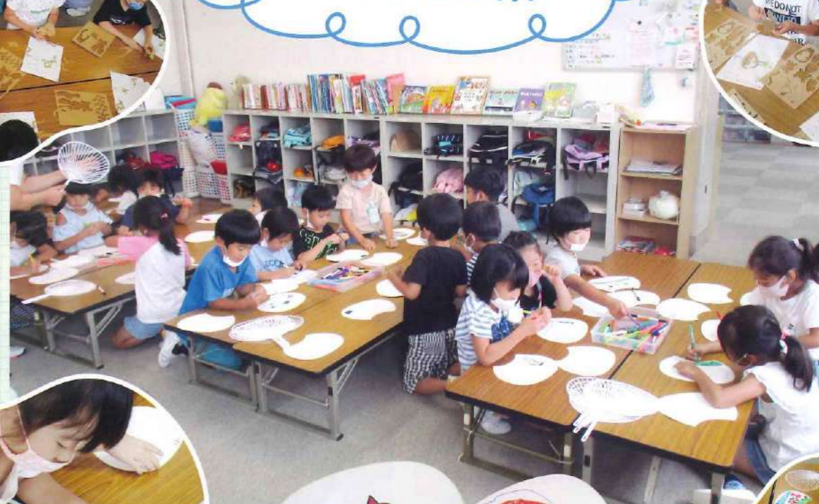
真剣に色塗り! 好きなイラストを 自由に描きました