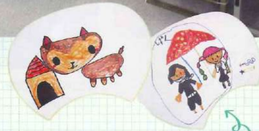
あの大人気アニメの キャラクター?