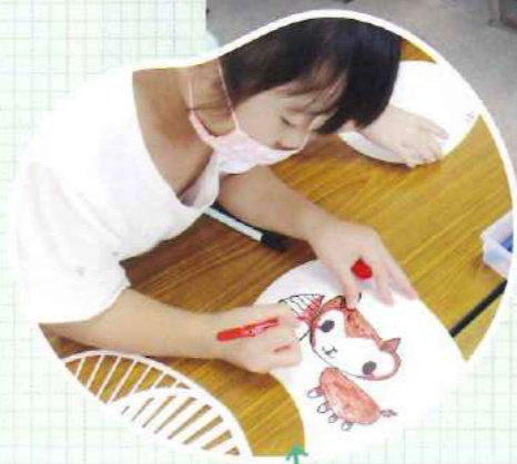
一生懸命色を塗っています