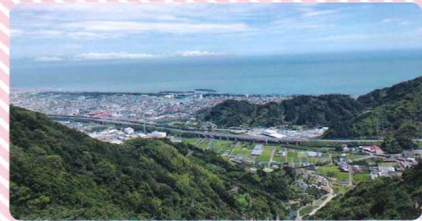
小坂の朝鮮岩より用宗漁港を望む