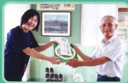
杉浦会長より長田南小にて 工作キットの寄贈

令和2年度『夏休み体験教室』が 新型コロナウイルス拡大の影響により中止となり、 代わりに『工作キット』を全校児童に配布しました