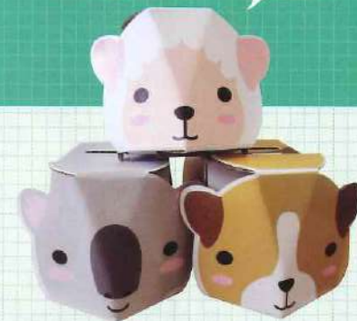
子どもでもカンタン! パズルのように組み立てます