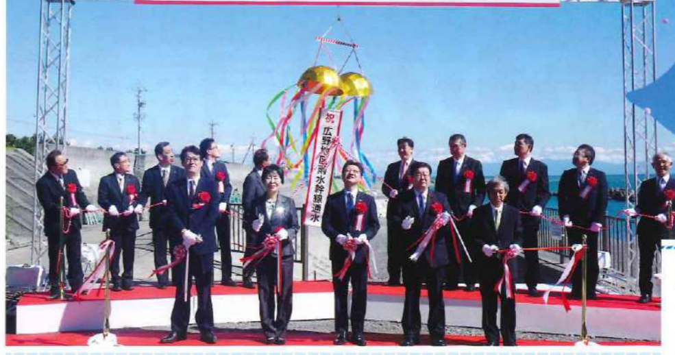
青空高く色とりどりの風船が 舞い上がりました