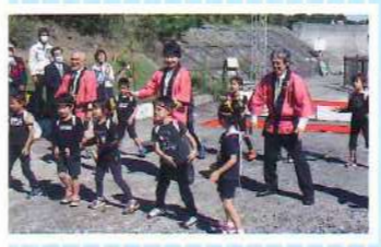
広野こども園の園児たちが 踊りを披露しお祝いました