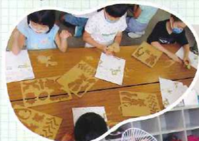
みんなと一緒に おしゃべりしながら 楽しく作りました