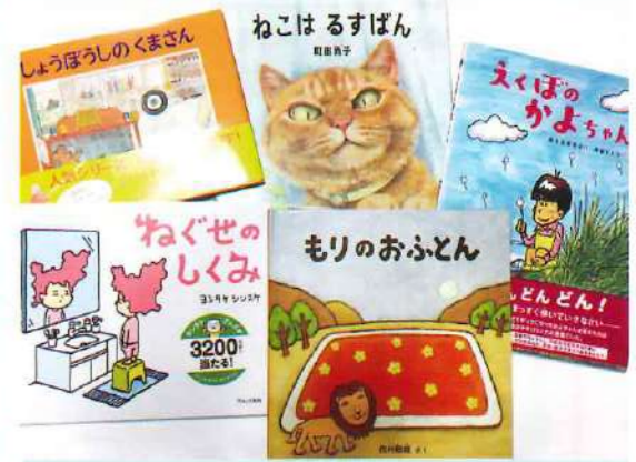
今年も用宗・広野こども園、 ひばり幼稚園へ各10冊程度、寄贈しました