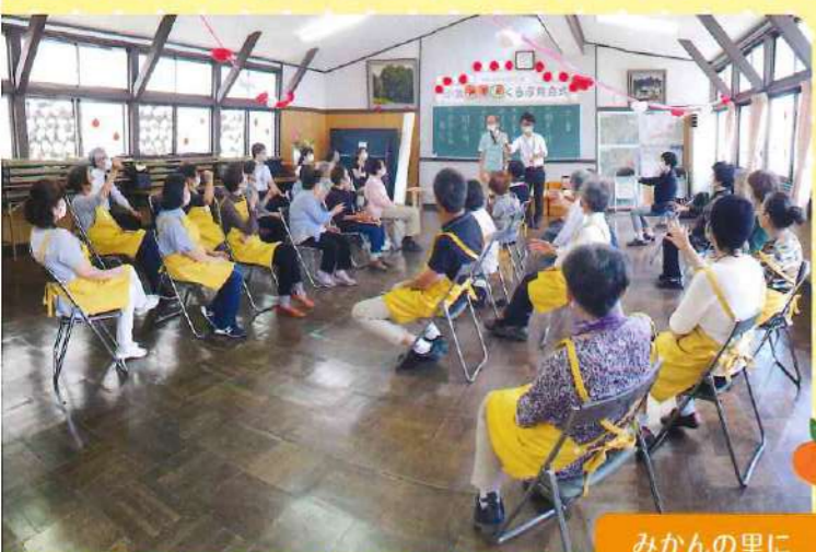
みかんの里に 笑い声がいっぱい

待ちに待った発会式…来賓の方々はじめ参加者はみんな笑顔♪ 地域のつながりがより深まることでしょう