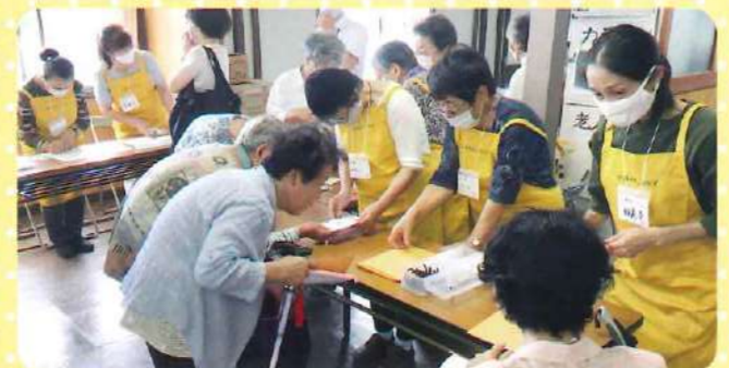
参加者は、検温後、手指の消毒、マスク着用で参加し、 着席間隔を広くして楽しみました

令和3年3月1日現在、新型コロナウイルス感染症拡大による感染予防のため、長田南地区のS型デイサービス (ももくらぶ・しらすくらぶ・うめくらぶ・いそくらぶ・みかんくらぶ)の活動は休止しています