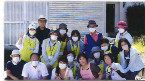
皆さんの笑顔にお会い出来るのを、ボランティア一同楽しみにお待ちしております♪