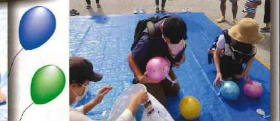
★ハイハイレース～ボールゲッチュ (※今後の活動予定は、2ページに続く)