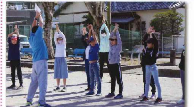
思いっきり身体を動かすって、楽しい!