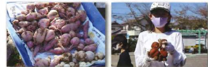
こんなに大きいお芋がいっぱい獲れたヨ!