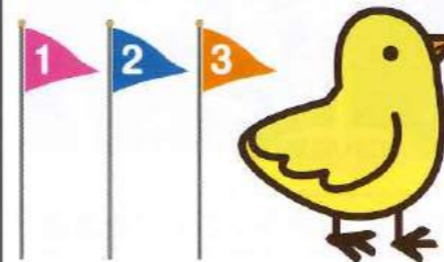
★じゃうずに キャッチできるかな

人が直接会えるのは、やはりリモートには無い、人との交流やつながりの大切さがあると実感できた一日でした*(^o^)/*