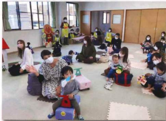
11月8日(月)開催された、さっちゃんの部屋にて。

来年度は5月から!より一層パワーアップして開催予定です。ぜひ、楽しみにしてください♪