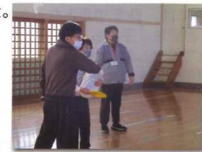
長田東小学校体育館では、フライングディスクも体験できます!