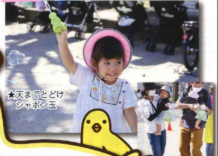
★天までとどけ シャボン玉