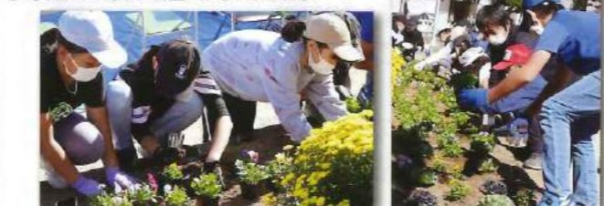
自治会&子ども会の連携プレーで、より絆が深まりました。花壇に可愛い花が咲きますように!

コロナ禍が続く、自治会や子ども会の催しが少ない中、この日は、久しぶりに外で気持ちいい汗が流せて大満足な一日でした!