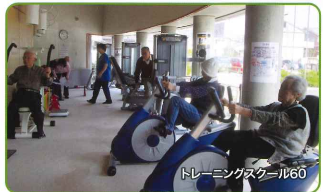
トレーニングスクール60