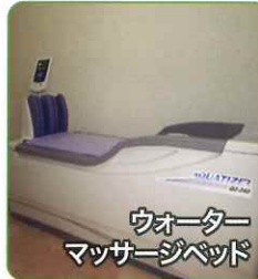
ウォーター マッサージベッド