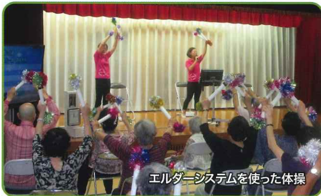
エルダーシステムを使った体操