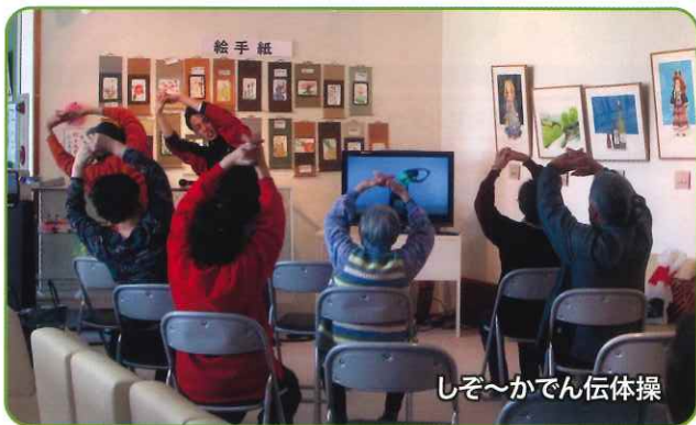
しぞ〜かでん伝体操