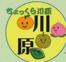
シンボルマーク由来

また、ちよっくら川原では引き続きボランティアを募集しています。こちらも申込先までご連絡を。