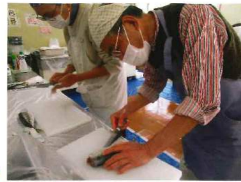
「魚のさばき方と上手なお刺身の盛りつけ方」