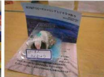
「用宗でピーチコーミングとクラフト体験」