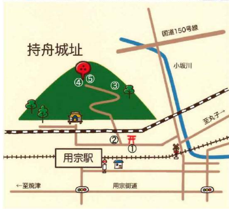
①用宗水神社②登り口③新幹線とJRと富士山が見えるスポット④頂上の持舟城址の石碑⑤頂上からは海と街を一望できます