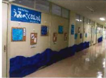
梨花幼稚園の園児による「海の絵作品展」