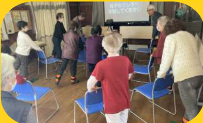
12/11に体験会が行われました♡