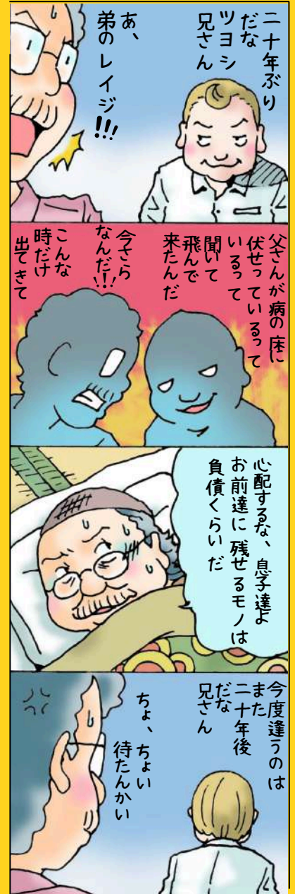
イラスト 餅月 崇